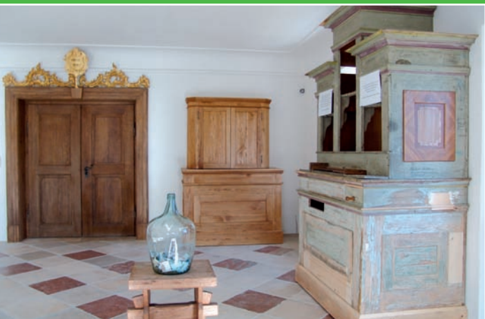
Die restaurierungsbedürftige Orgel aus Walpersdorf

Der Förderverein Orgelmuseum e. V. hat zwei Aufgaben-Bereiche , einen für die Zukunft, dass die Gesamtanlage künftig als Museum der Öffentlichkeit zur Verfügung gestellt werden kann, und einen in der Gegenwart, dass zur Restaurierung von Instrumenten, die nicht im Eigentum des Orgelzentrums stehen (also z. B. Dauerleihgaben) mitfinanziert werden kann.